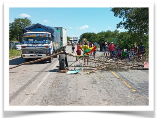
Wegblokkade in Bolivia.

Het was een lange reis met hindernissen vanuit België Zaventem naar Bolivia via Frankfurt en Sao Paulo naar Campo Grande in Brazilië. Eenmaal in Sao Paulo aangekomen bleek dat niet alle koffers waren aangekomen waarop later gewacht moest worden in Campo Grande in Brazilië. Ook waren er in de tussentijd politieke onrusten ontstaan in Brazilië na de uitslag van de verkiezingen die plaatsvonden tijdens de vlucht van An en Gerjanne. Hierdoor waren er kortstondig vervoersstakingen in Brazilië en kon er op dat moment niet worden verder gereisd naar Corumbá dichtbij het grensgebied met Bolivia. Eenmaal in Bolivia kon er ook niet meteen worden doorgereisd naar El Carmen omdat er ook in Bolivia vervoersstakingen waren.