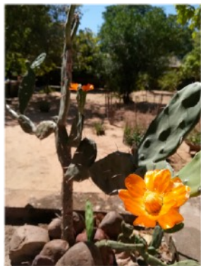
Bloem van de cactus