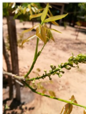
Eerste vruchtjes van Lychee boompje